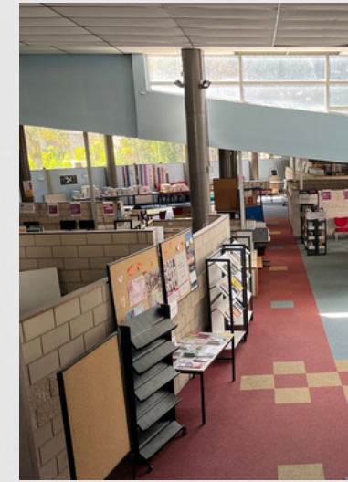
CDI (cour de récré)