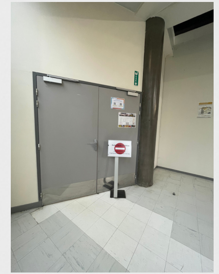
Salle des professeurs (coté pair)