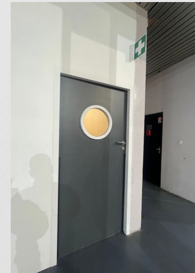
Infirmierie (coté impair)