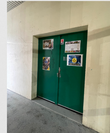
Salle de musculation (cour de récré)