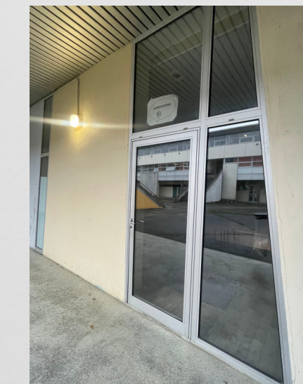
Reprographie (cour de récré)