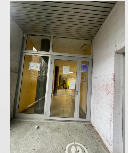
Réfectoire (cour de récré)