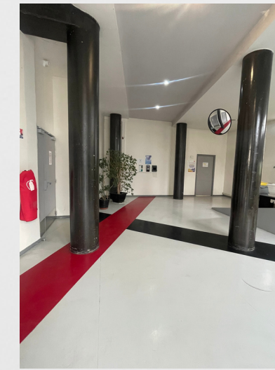
Administration (coté impair)